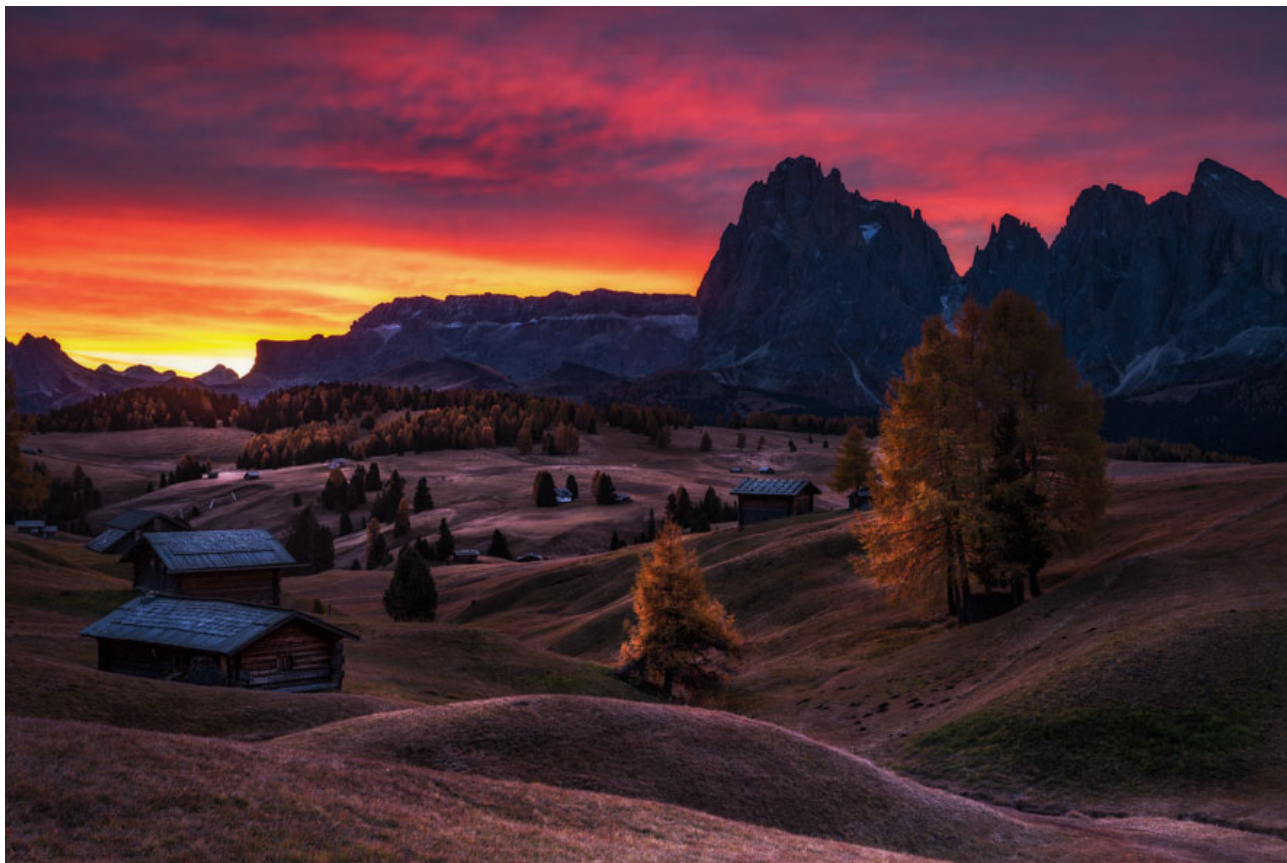
Amanecer en llamas Alpe di Siusi (Seiser Alm). Dolomitas