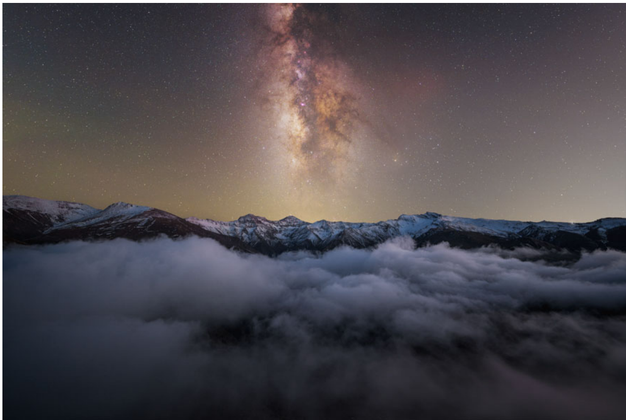
Cielo, tierra y mar de nubes Sierra Nevada, Granada