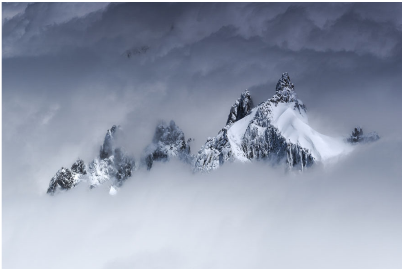
Cuando todo parecía perdido... Mont Blanc