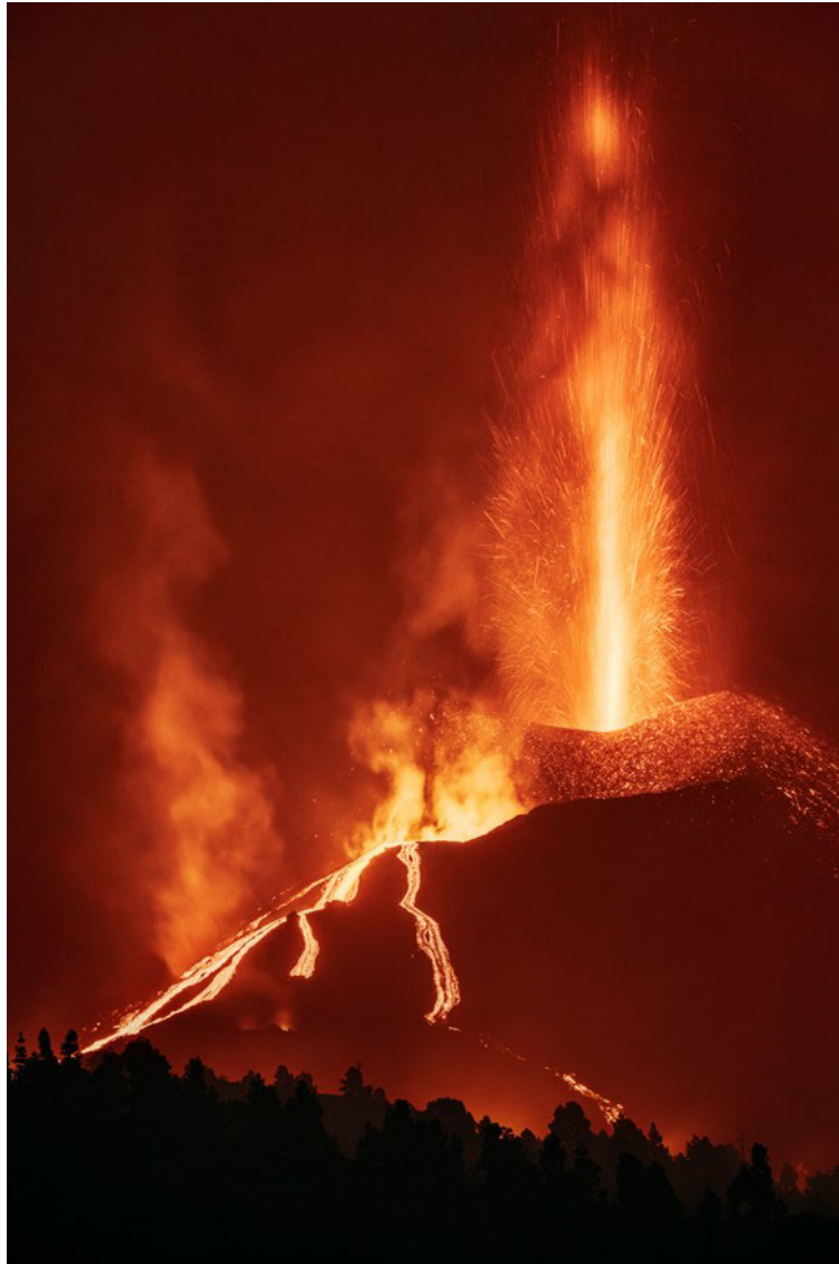
Fuerza incandescente Volcán de Tajogaite, La Palma