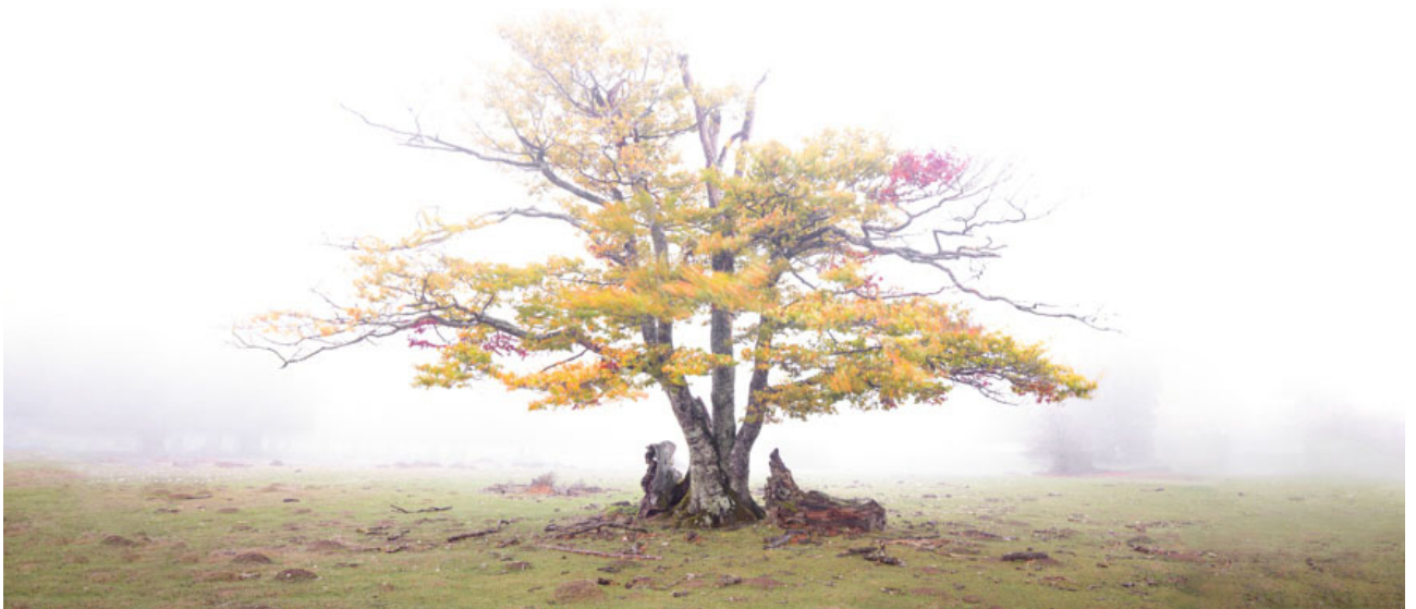
El guardián del claro Parque Natural de Urbasa y Andía, Navarra