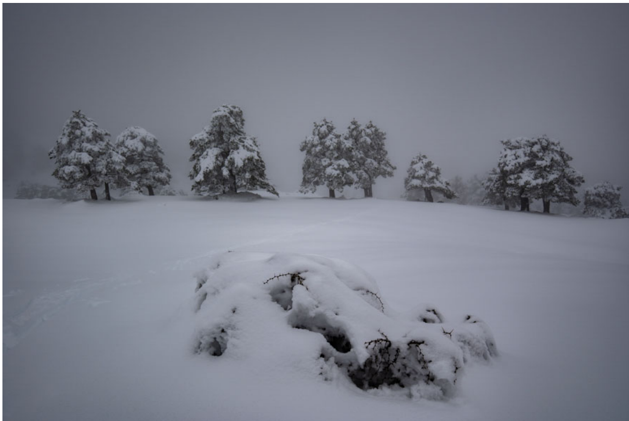
Entre la niebla Sierra de Baza, Granada