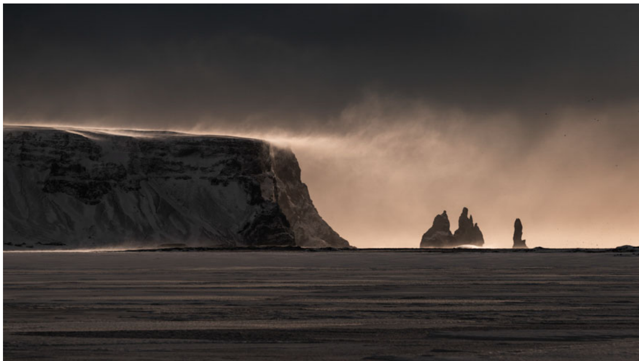
Silencio bajo el soplo glacial Reynisfjara, Islandia