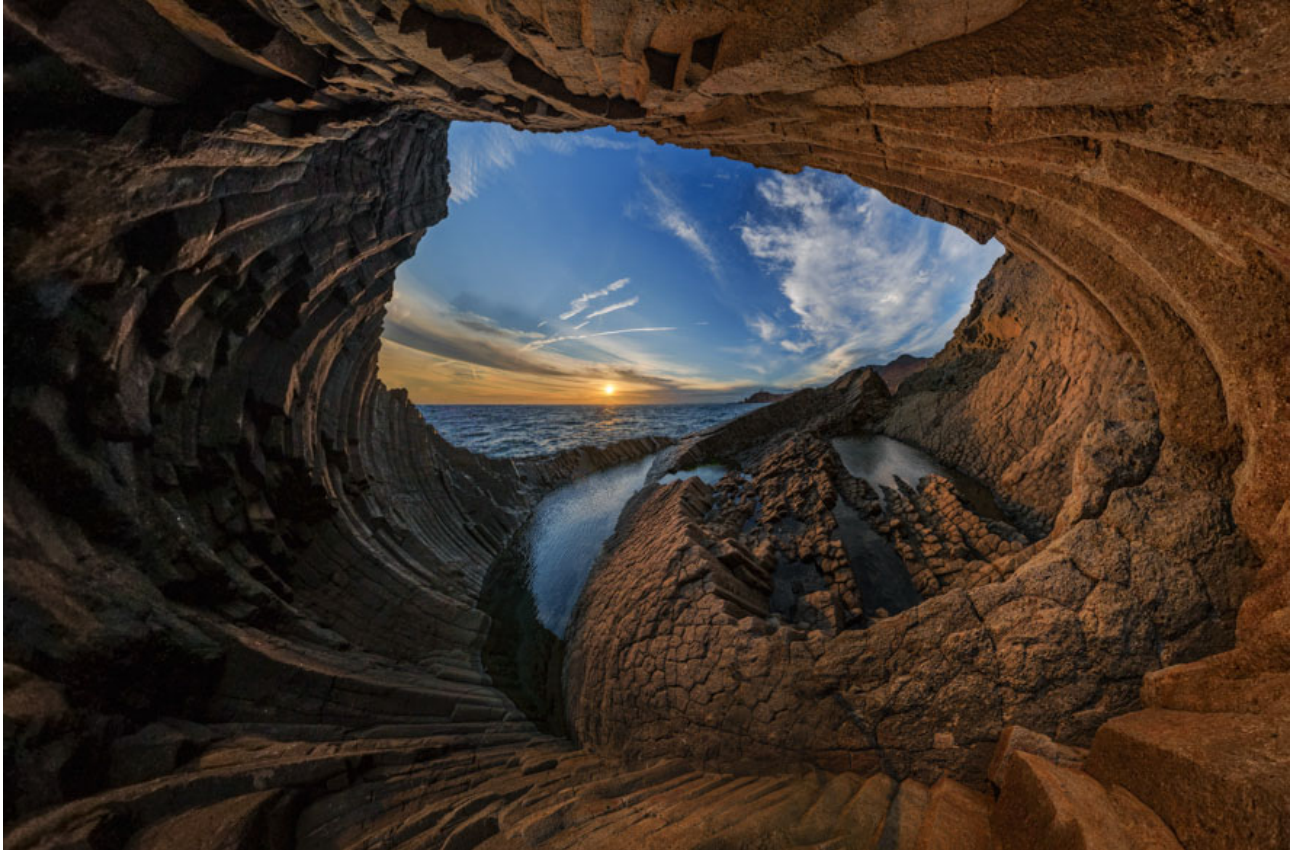
Tierras basálticas Cabo de Gata, Almería