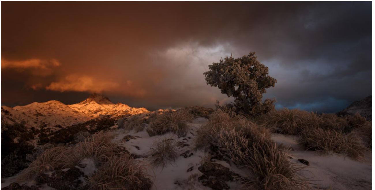
La lucha Sierra Nevada, Granada