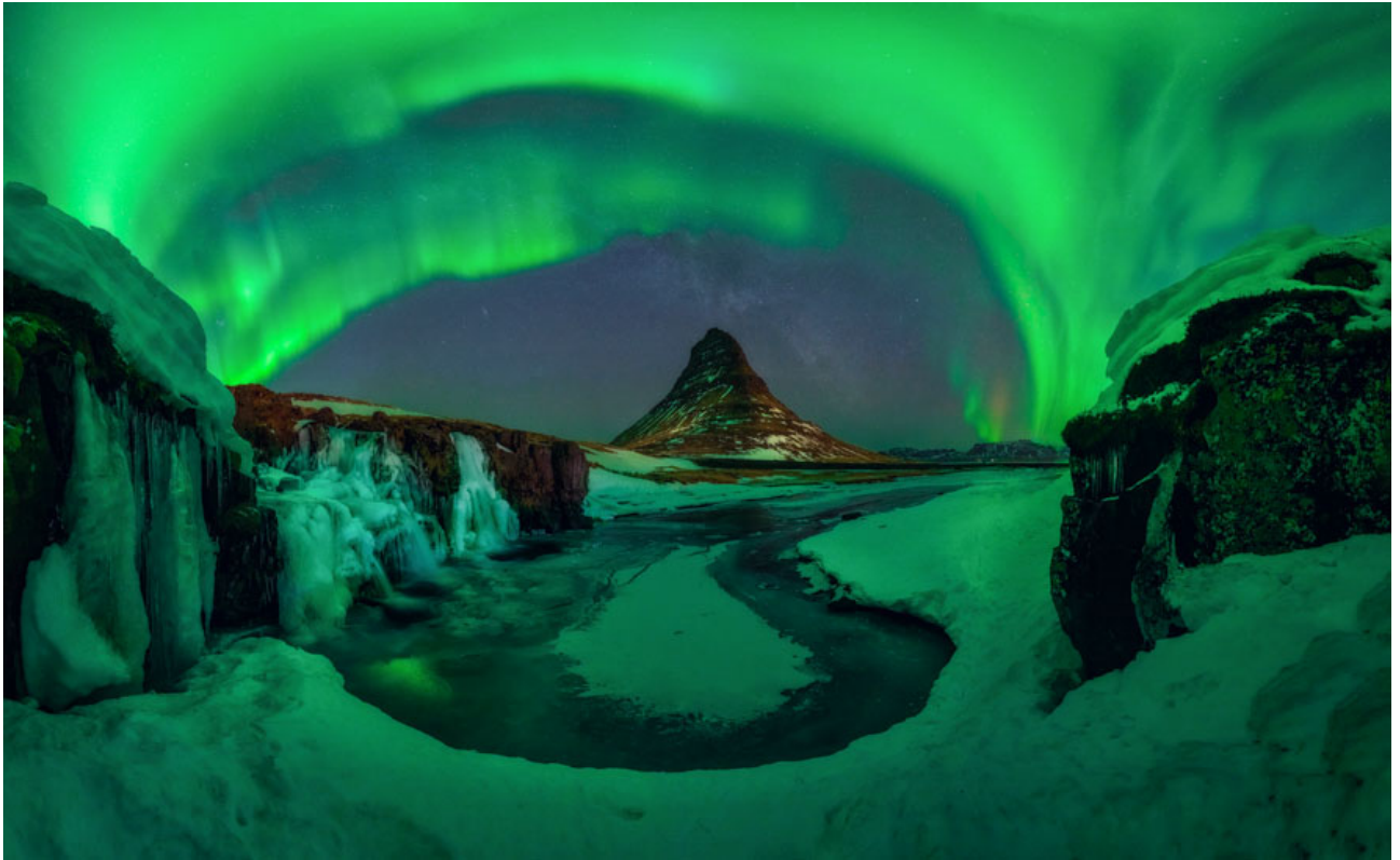
Un baile soñando Kirkjufell , Islandia