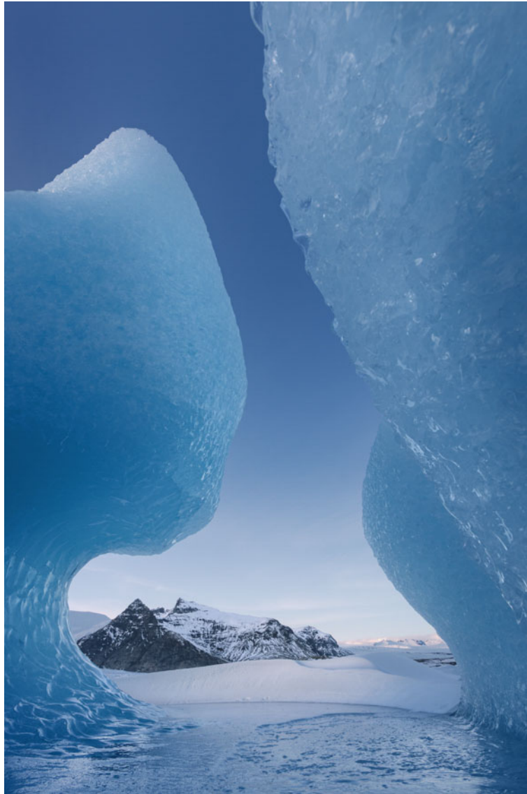
Umbral glaciar Laguna glaciar de Fjallsarlón, Islandia