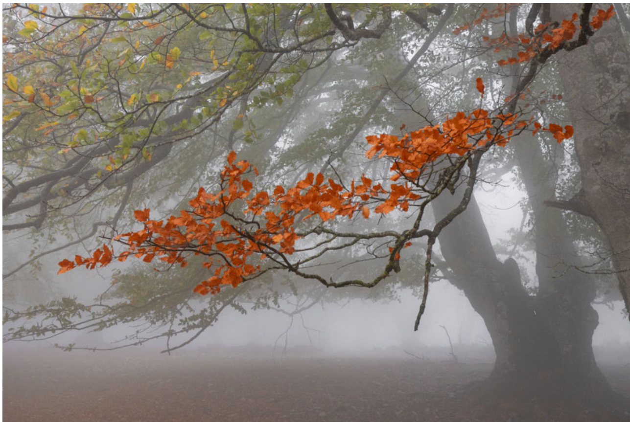
Otoño por accidente Parque Natural de Urbasa y Andía, Navarra