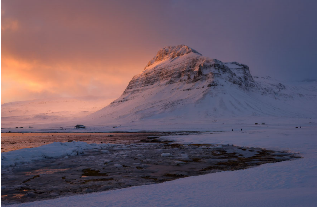
Caricias al despertar Snæfellsnes, Islandia