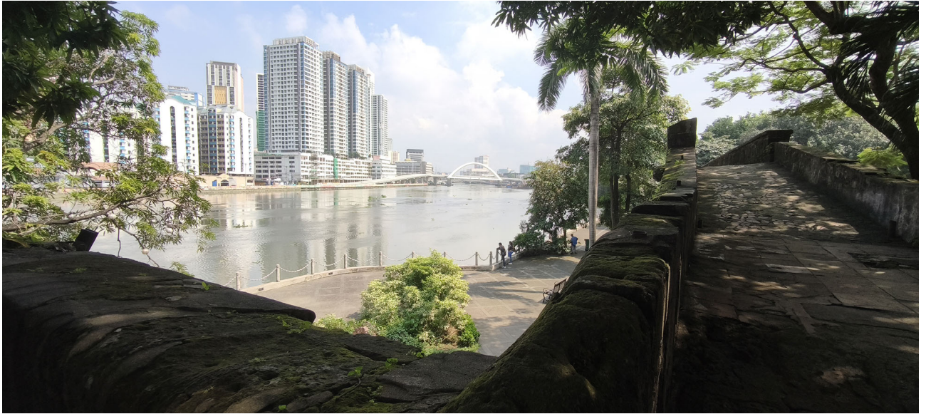
Desbordes #1 | Fotografía digital 27 x 60 cm Metamark Semi-Gloss sobre PVC