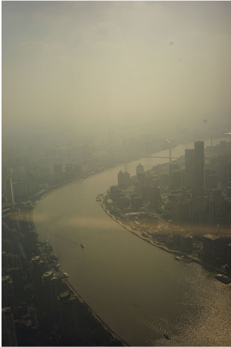
Desbordes #3 | Fotografía digital 39 x 26 cm Metamark Semi-Gloss sobre PVC