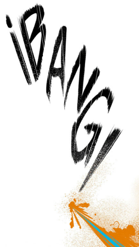
Frontera | Técnica mixta 6 paneles de 30 x 60 cm Impresión digital sobre soporte rígido