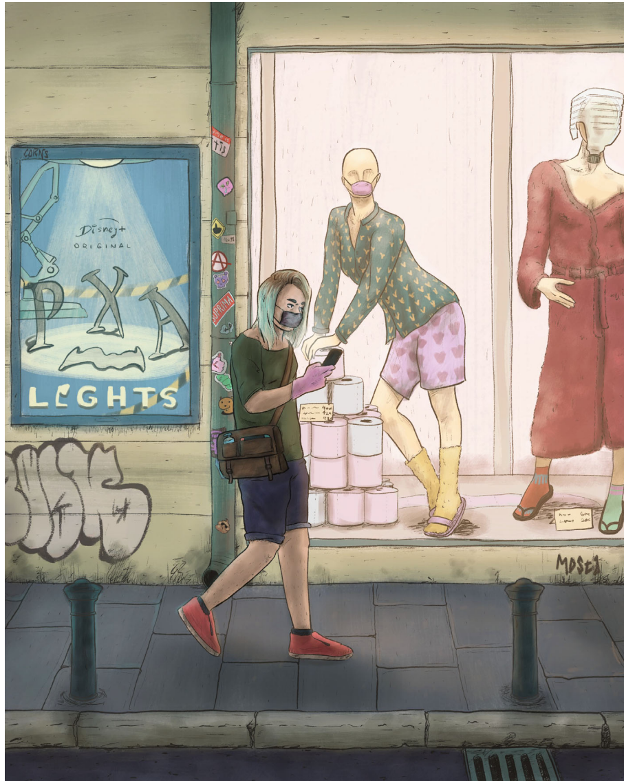
Moda de pandemia | Arte digital 30 x 37,5 cm Impresión digital sobre soporte rígido