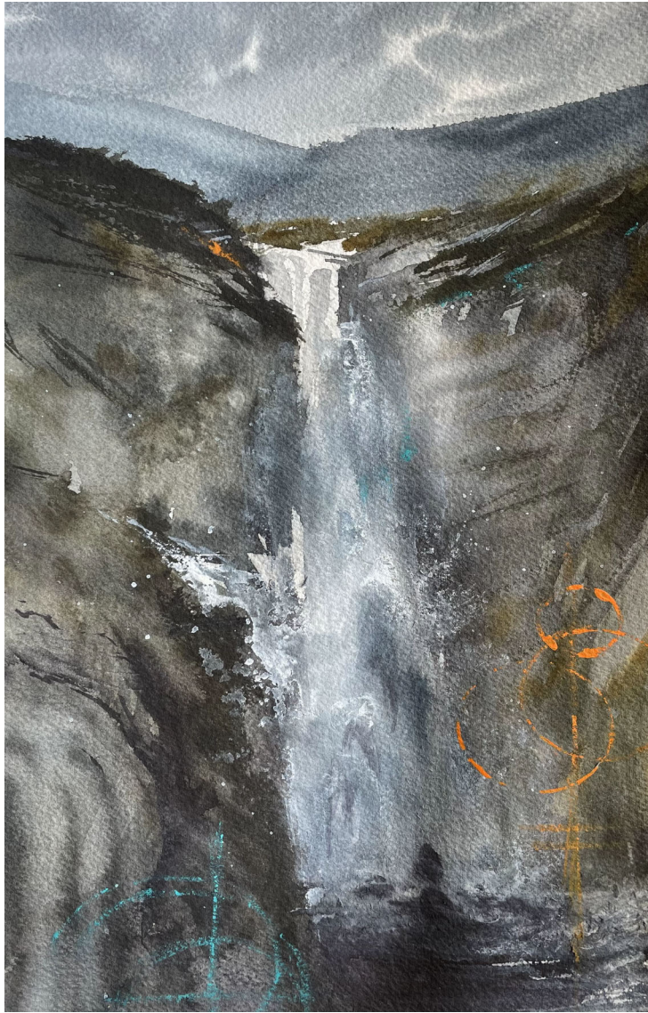
Cascada #2 | Acuarela sobre papel 39 x 22 cm