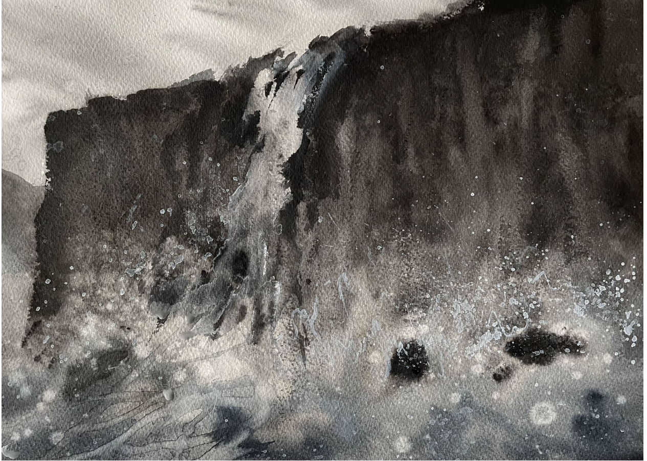
Cascada #1 | Acuarela sobre papel 31 x 38 cm