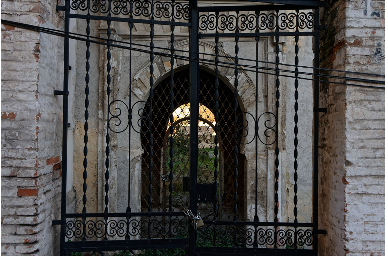
Desbordes #2 | Fotografía digital 20 x 30 cm Metamark Semi-Gloss sobre PVC