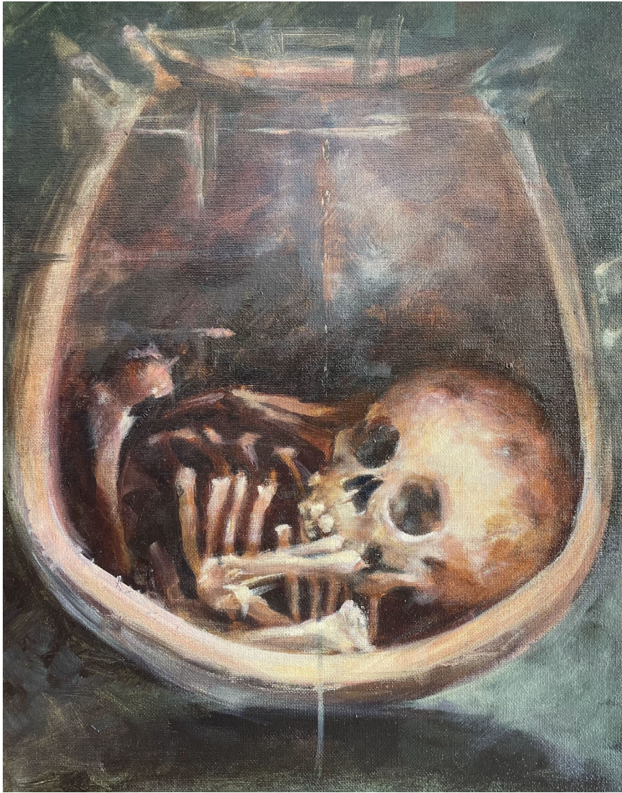
Clausura | Óleo sobre tablilla entelada 40 x 32 cm