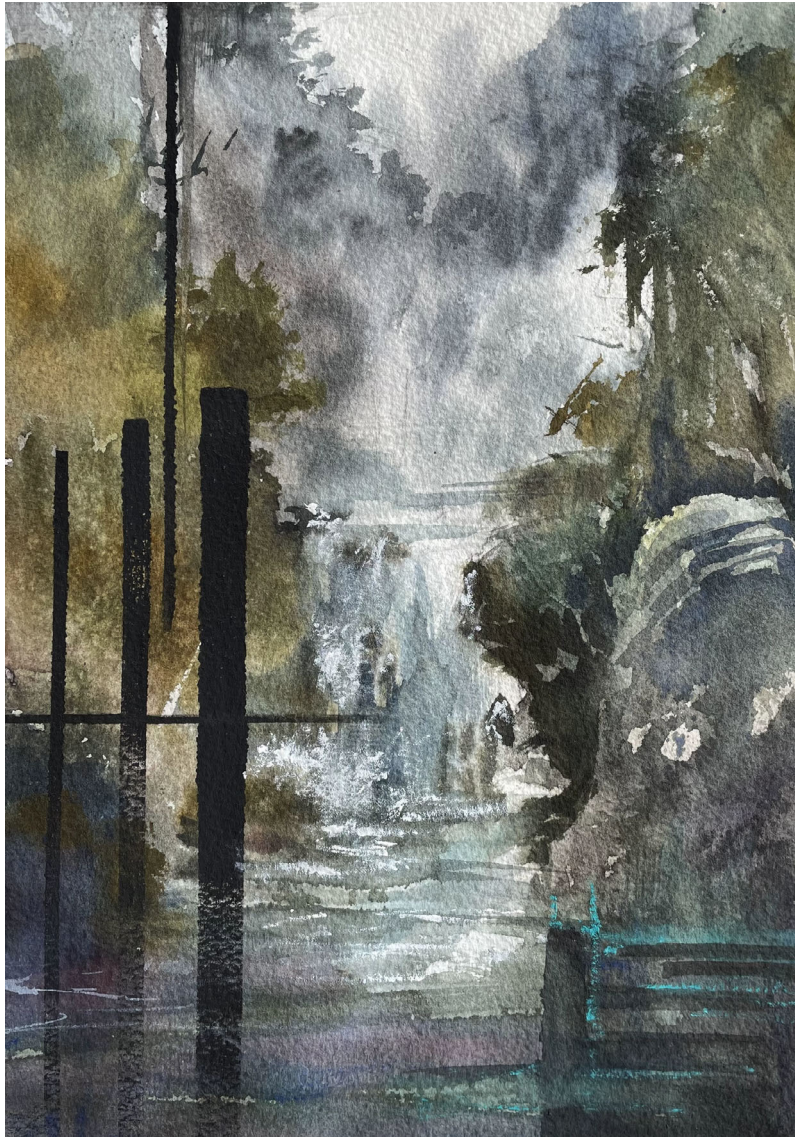
Cascada #3 | Técnica mixta sobre papel 31 x 23 cm