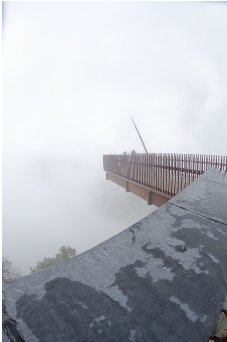
Desbordes #4 | Fotografía digital 39 x 26 cm Metamark Semi-Gloss sobre PVC