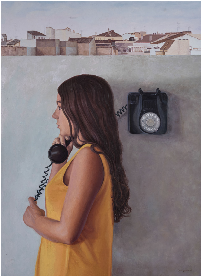
Vestido amarillo | Óleo / lienzo 73 x 100 cm