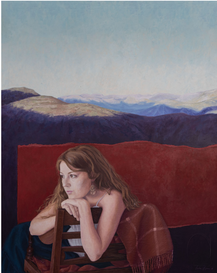
Senderos del sentido | Óleo / lienzo 100 x 125 cm