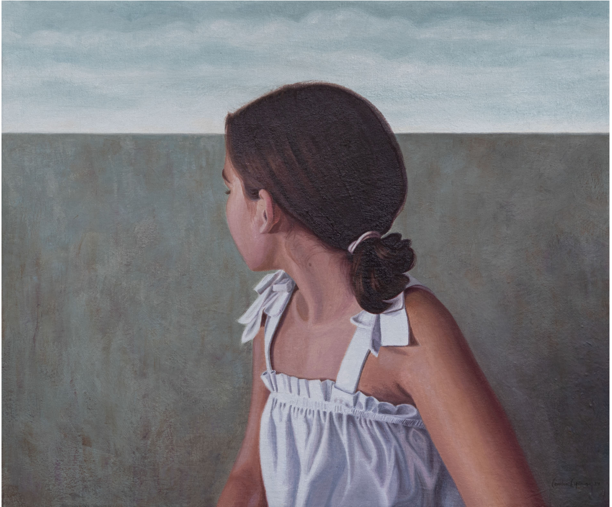
Mirada al pasado, horizonte al futuro | Óleo / lienzo 55 x 46 cm