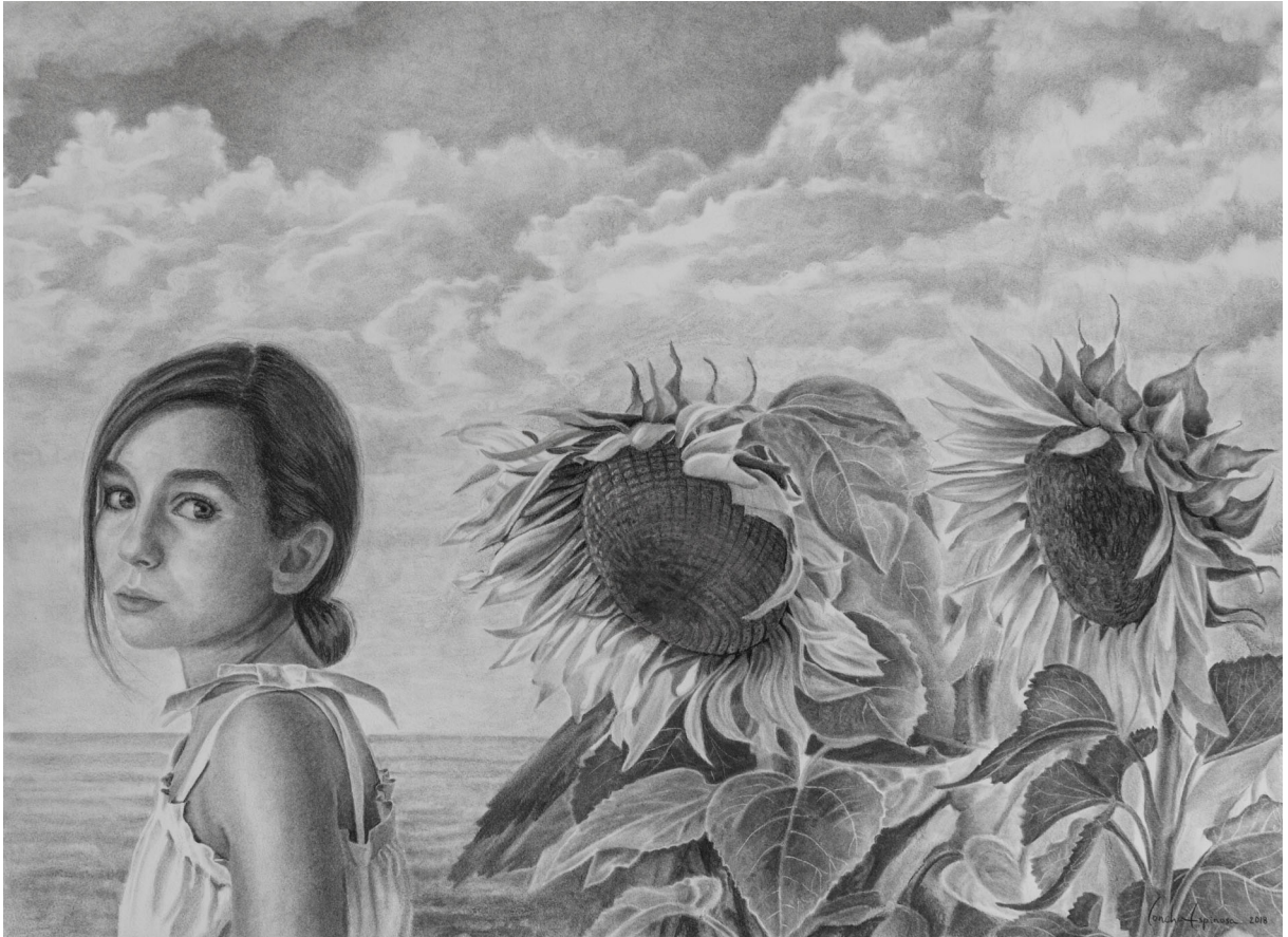
Girasoles | Carboncillo / papel 75 x 54 cm