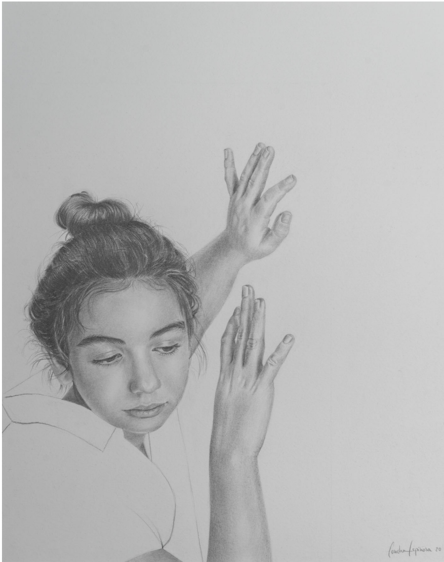
Miedos | Grafito / papel 37 x 46 cm