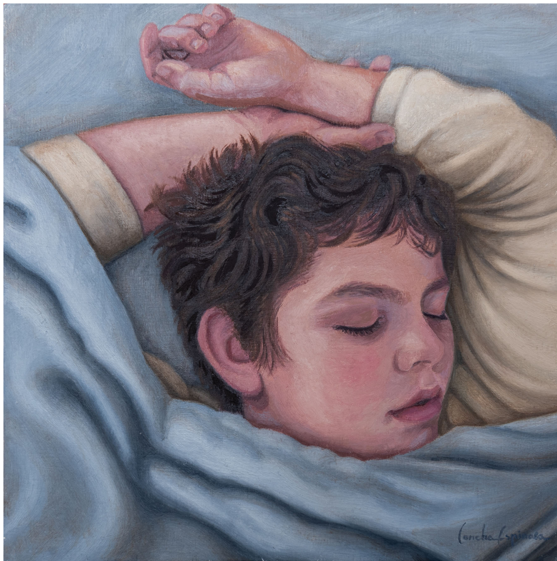
Javier | Óleo / tabla 20 x 20 cm